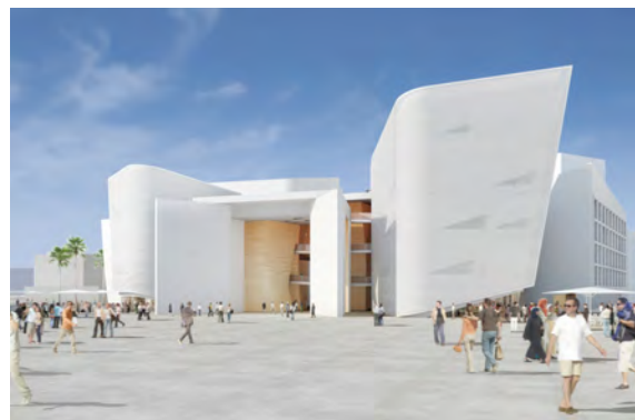
Schéma de développement culturel de la CIREST

Diagnostic culturel sur le territoire est-réunionnais. Définition d'orientations stratégiques pour l'intercommunalité. Elaboration d'un plan d'action, organisationnel, juridique et financier.